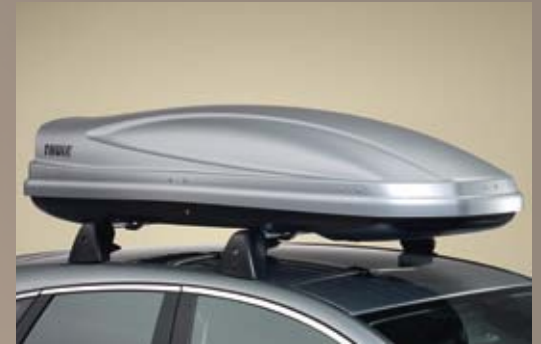
THULE Dachbox „Atlantis 780“ 17 32 131