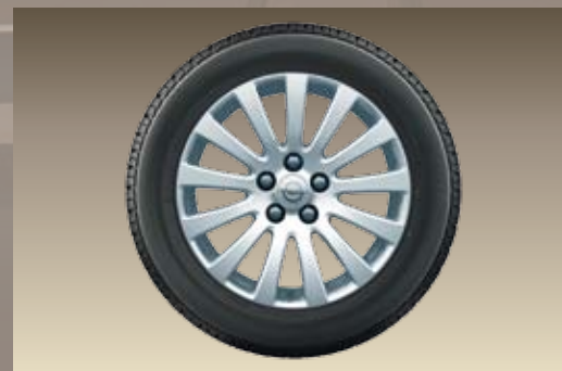
Winterkomplettrad 18 Zoll 10 20 518 (Continental), 10 20 569 (Michelin)