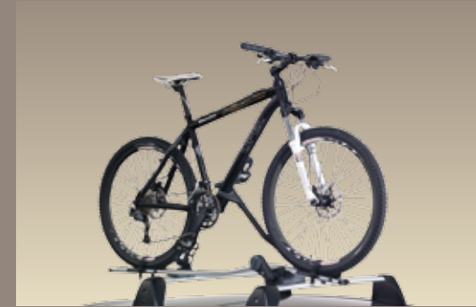
THULE Fahrradträger „ProRide“ 17 32 140