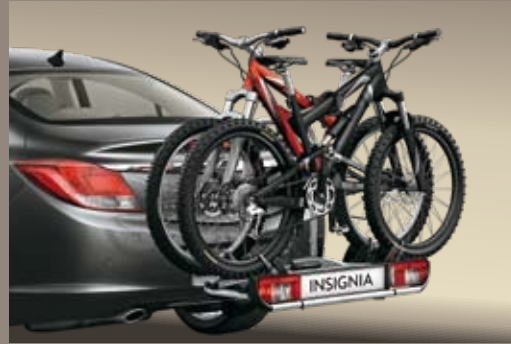
Heckfahradträger 17 32 665