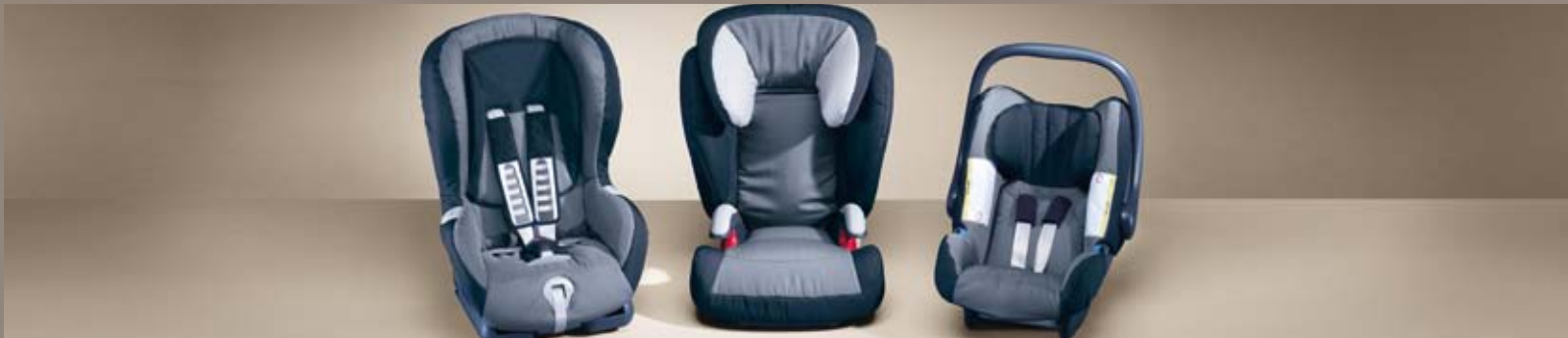
Kindersitz DUO ISOFIX 17 46 534