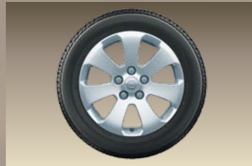
Winterkomplettrad 17 Zoll 10 20 517 (Continental), 10 20 568 (Michelin)