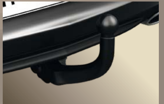
Anhängervorrichtung* 17 36 371-374