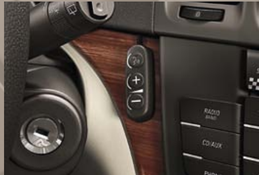
Bluetooth™-Freisprecheinrichtung* nur 273,- 17 80 716