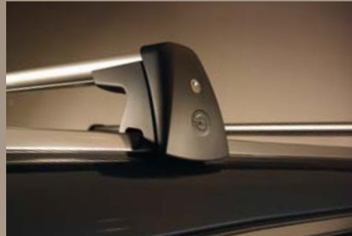
Aluminium-Basisträger 67 32 548