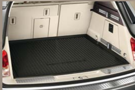
Laderaumschale 17 22 158