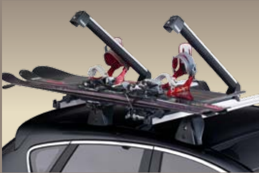
THULE Skiträger „Xtender 739“ 17 32 146