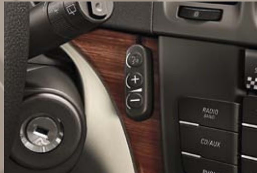
Bluetooth™-Freisprecheinrichtung* nur 273,- 17 80 716