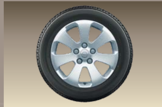
Winterkomplettad 17 Zoll 10 20 517 (Continental), 10 20 568 (Michelin)