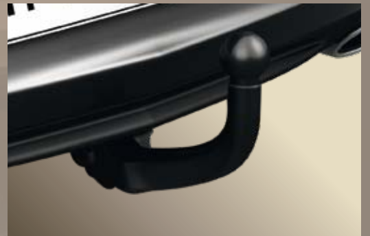
Anhängervorrichtung* 17 36 372-373