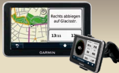
GARMIN nüvi® 2350 LT GN 09 02 14