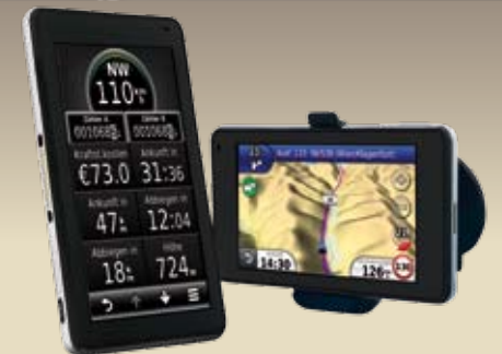
GARMIN Navigationssystem 3760 T GN 08 58 11