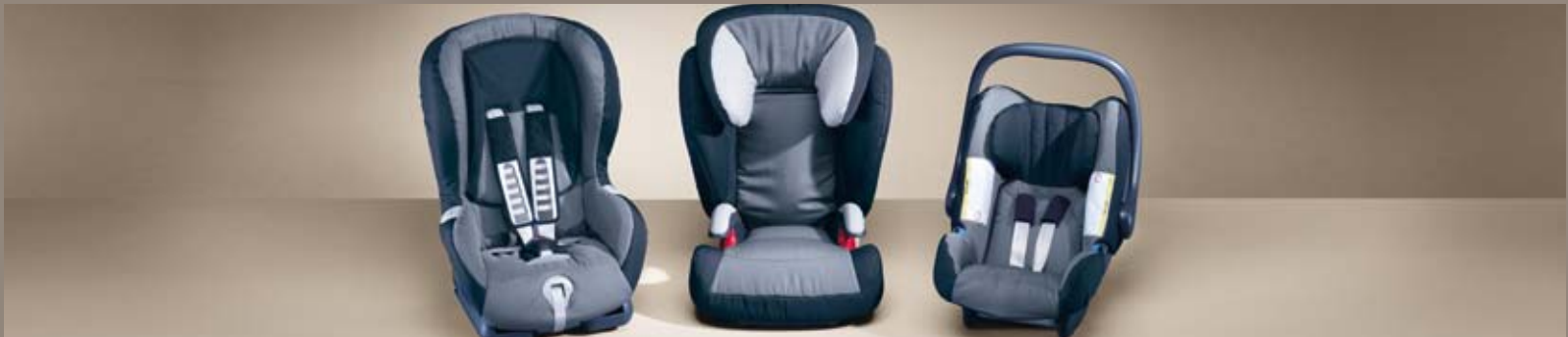
Kindersitz DUO ISOFIX 17 46 534