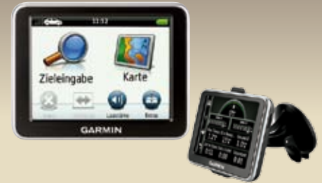
GARMIN nüvi® 2200 CEE GN 09 013 C