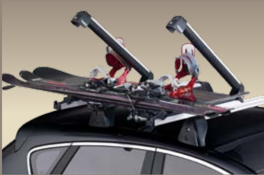
THULE Skiträger „Xtender 739“ 17 32 146