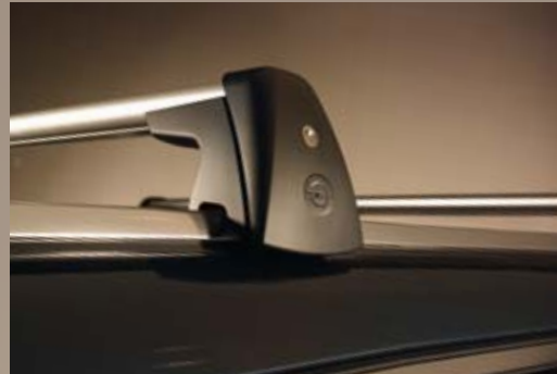
Aluminium-Basisträger 67 32 550