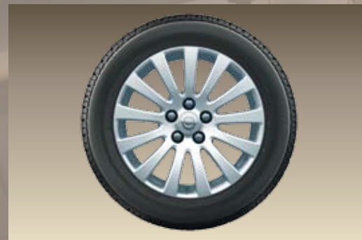
Winterkomplettad 18 Zoll 10 20 518 (Continental), 10 20 569 (Michelin)