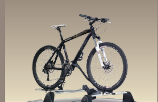
THULE Fahrradträger „ProRide“ 17 32 140