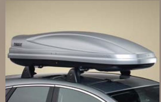
THULE Dachbox „Atlantis 780“ 17 32 131