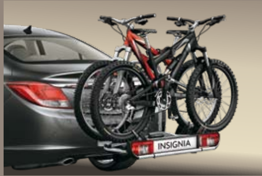
Heckfahradträger 17 32 665